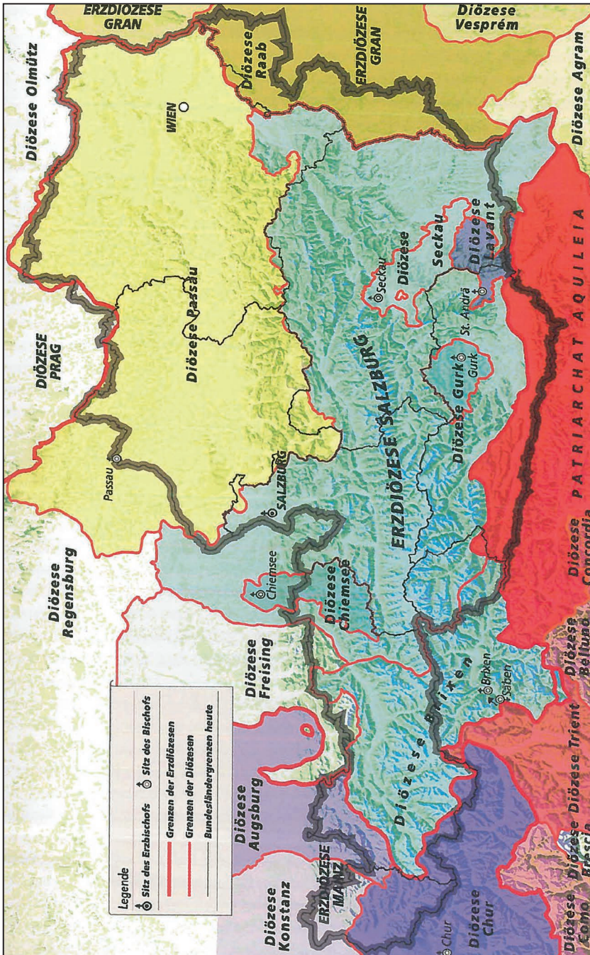
Abb. 1: Diözesangliederung in Österreich um 1200 (nach: SCHEIBELREITER, Christentum (2003), S. 87).